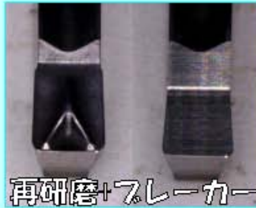
再研磨+フレーカー

注意) 使用済みのチップの為、新品時の寿命には届かない時もあります。 磨耗が進んでいる使用済みチップは、再利用不可能な時もあります。