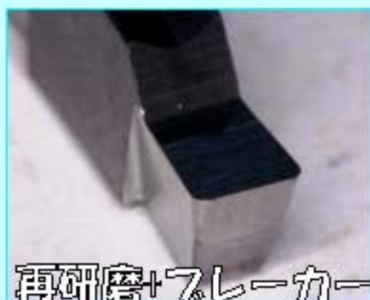
再研磨+フレーカー