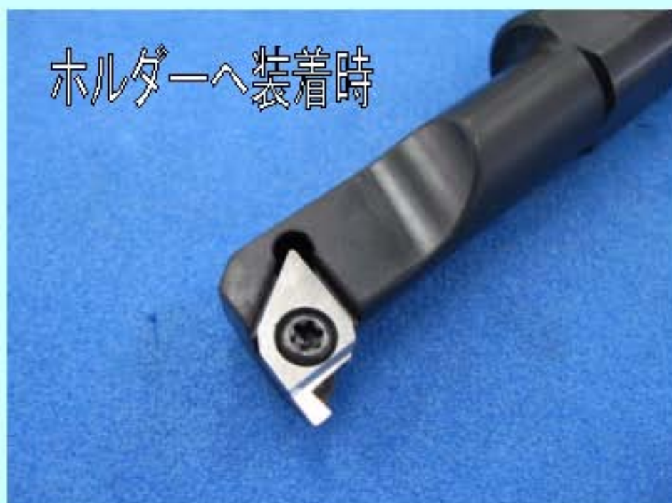
ホルダーへ装着時